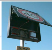
Alimentation Sur Eclairage Public