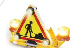
Intégral Classic caréné