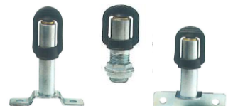
Tube de raccordement