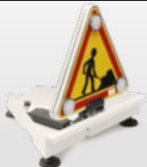
Intégral Classic caréné magnétique