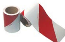
Sérigraphie des véhicules