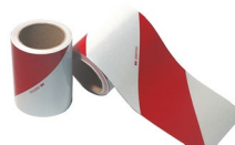
Sérigraphie des véhicules