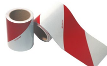
Sérigraphie des véhicules