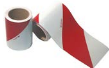
Sérigraphie des véhicules