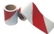
Sérigraphie des véhicules