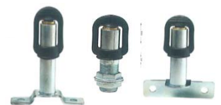
Tube de raccordement