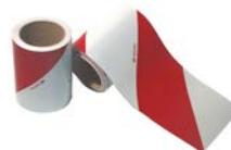
Sérigraphie des véhicules