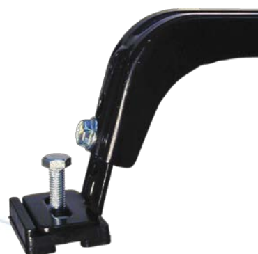
Photo de l'attache non contractuelle