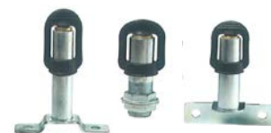
Tube de raccordement