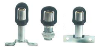
Tube de raccordement