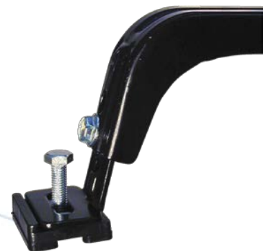
Photo de l'attache non contractuelle