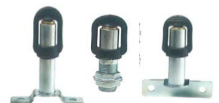
Tube de raccordement