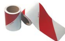
Sérigraphie des véhicules