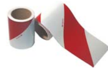
Sérigraphie des véhicules