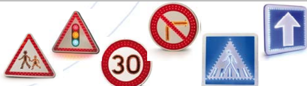
Panneaux renforcés BTR