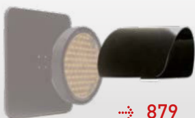
Visière pour optique Ø 200