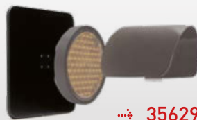
Écran de contraste pour optique Ø 200