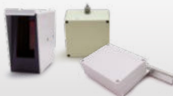
Options de Détections