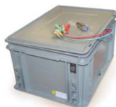
Coffret porte batterie