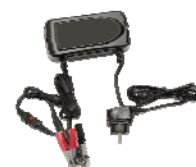
Chargeur de batterie 12V 8A 96W