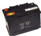
Batterie 12V 75A/h